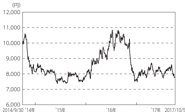
&lt;設定来の基準価額の推移&gt;