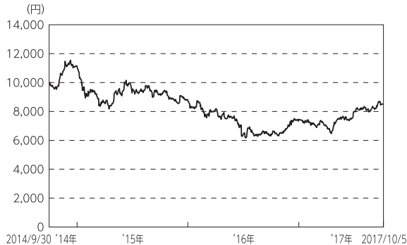
＜設定来の基準価額の推移＞