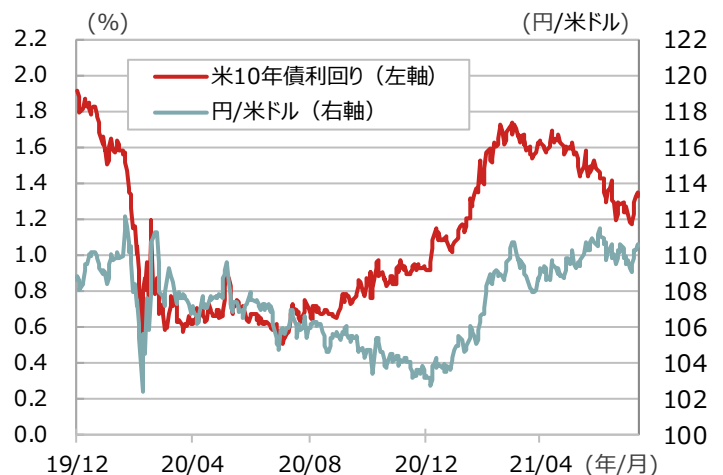
米10年債利回りと為替の推移

期間：2019年12月31日～2021年8月11日、日次 （出所）Bloombergより野村アセットマネジメント作成