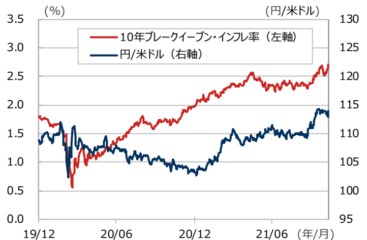
米ブレイクイーブン・インフレ率と為替の推移

期間：2019年12月31日～2021年11月10日、日次