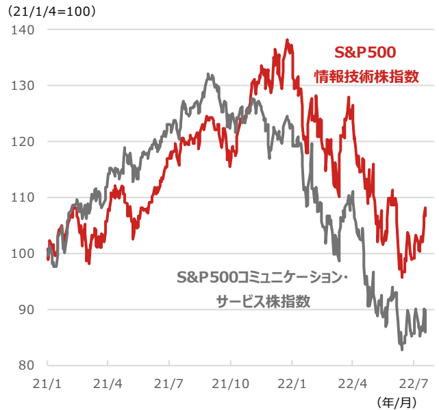
期間：2021年1月4日～2022年7月22日、日次