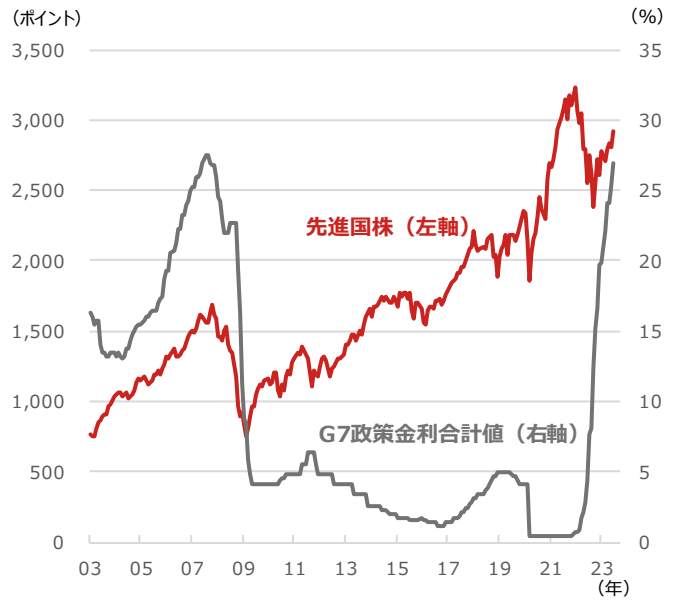
先進国株とG7（先進7カ国）政策金利合計値

期間：2003年1月末～2023年6月28日、月次 ・先進国株：MSCI World Index、米ドルベース ・G7政策金利合計値：米国、ユーロ圏（ドイツ、フランス、イタリア）、日本、英国、カナダの政策金利合計値 （出所）Bloombergより野村アセットマネジメント作成