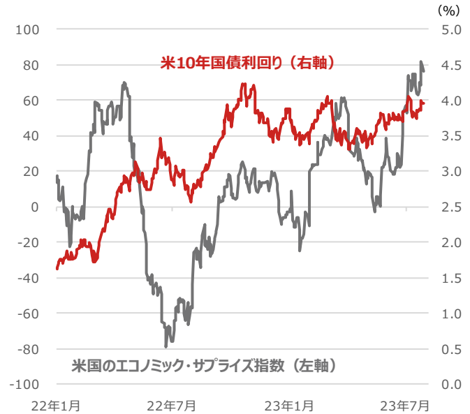
米10年国債利回りと米国のエコノミック・サプライズ指数

期間：2022年1月3日～2023年7月31日、日次 ・米国のエコノミック・サプライズ指数は、各種経済指標の発表値と事前の市場予想の乖離度合いを指数化したもの。米シティグループが算出。市場予想よりも各種指標の実績が上回れば指数はプラス方向に振れ、逆に下回れば指数はマイナス方向に振れる。