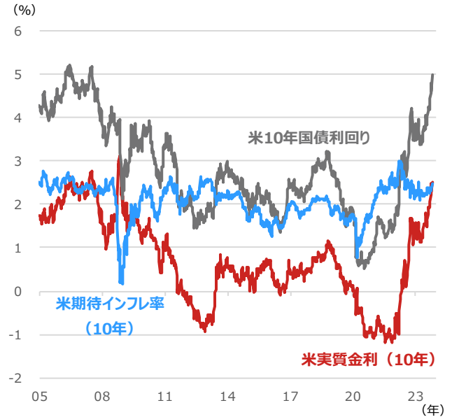
期間：2005年1月7日～2023年10月19日、週次 ・米期待インフレ率（10年）＝米10年国債利回り－米物価連動国債（10年）利回り ・米実質金利は米物価連動国債（10年）利回りを用いた