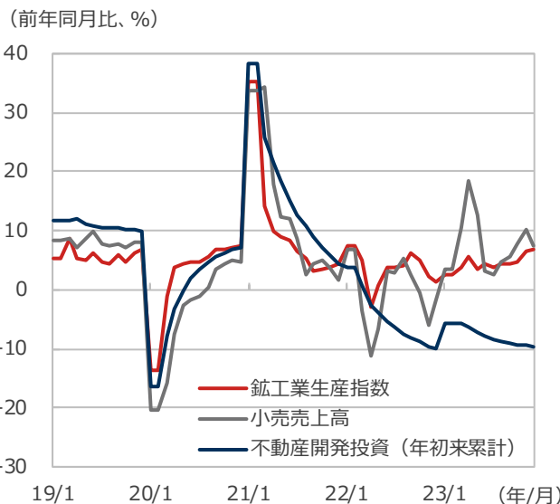
中国の主要経済指標

期間：2019年1月～2023年12月、月次