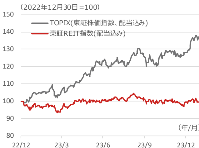
東証REIT指数とTOPIXの推移

リート(東証REIT指数)は2023年前半は下落傾向にありましたが、3月中旬に底入れし、夏までは緩やかに上昇しました。その後は再び軟調となり、2023年10月末～24年1月末の直近3ヵ月間では+0.1%と、+13.4%だったTOPIXに比べて劣後するパフォーマンスでした。なお、2022年12月末以来のパフォーマンスは、リートが▲0.6%でTOPIXが+38.3%と、大差がついています(右上図)。 ※全て配当込み。