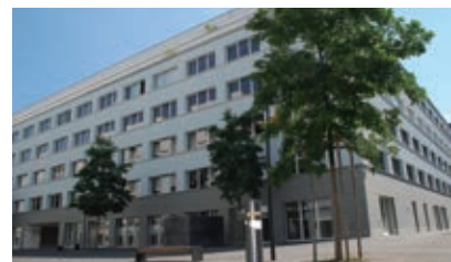
ロベコ・スイス・エージー本社 (スイス、チューリッヒ)

2024年2月、ロベコの日本法人ロベコ・ジャパンは、環境省が選定する第5回「ESGファイナンス・アワード・ジャパン」の投資家部門において銀賞(環境大臣賞)を受賞しました。