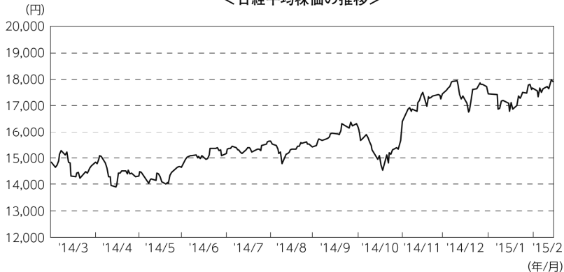
<日経平均株価の推移>

5月以降は、中国の景気指標の改善や米国株式市場の上昇などを好感したこと、政府の成長戦略への期待感が広がったことなどから再び上昇し、10月上旬に世界景気の先行き不透明感や米国内でのエボラ出血熱の感染拡大が懸念されたことから一時下落する局面があったものの、同月末に日銀が追加金融緩和を決定したことから上昇に転じました。2015年に入り、原油安やギリシャ政局の不透明感を背景に下落しましたが、ECB（欧州中央銀行）の量的金融緩和導入を受け、上昇しました。