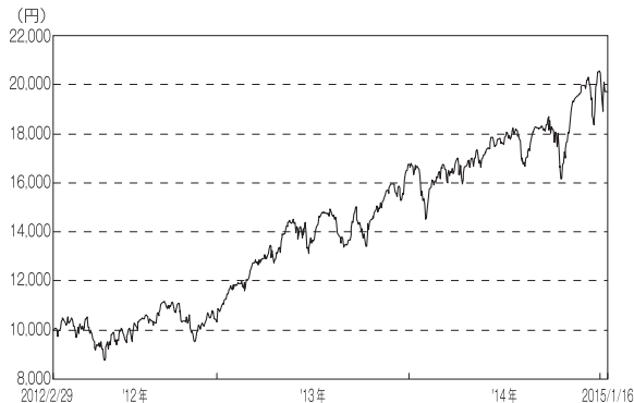
〈設定来の基準価額の推移〉