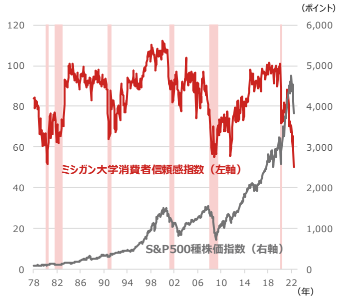
期間：（ミシガン大学消費者信頼感指数）1978年1月～2022年6月、月次 （S&P500種株価指数）1978年1月末～2022年6月29日、月次 ・網掛けは景気後退局面