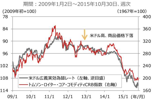
図3：米ドル広義実効為替レートと商品価格指数