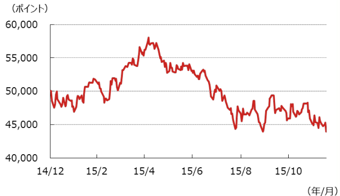
図3：10年国債利回り（現地通貨建て）の推移