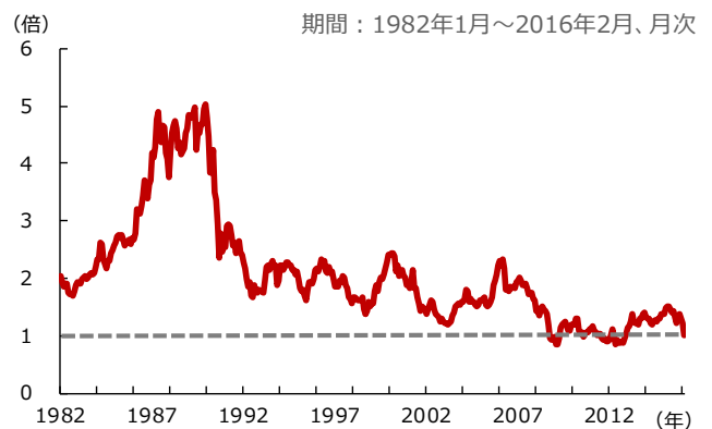
図2：日本株（TOPIX）のPBRの推移

当資料は、投資環境に関する参考情報の提供を目的として野村アセットマネジメントが作成したご参考資料です。投資勧誘を目的とした資料ではありません。当資料は市場全般の推奨や証券市場等の動向の上昇または下落を示唆するものではありません。当資料は信頼できると考えられる情報に基づいて作成しておりますが、情報の正確性、完全性を保証するものではありません。当資料に示された意見等は、当資料作成日現在の当社の見解であり、事前の連絡なしに変更される事があります。なお、当資料中のいかなる内容も将来の投資収益を示唆ないし保証するものではありません。投資に関する決定は、お客様ご自身でご判断なさるようお願いいたします。投資信託のお申込みにあたっては、販売会社よりお渡します投資信託説明書（交付目録見書）の内容を必ずご確認のうえ、ご自身でご判断ください。