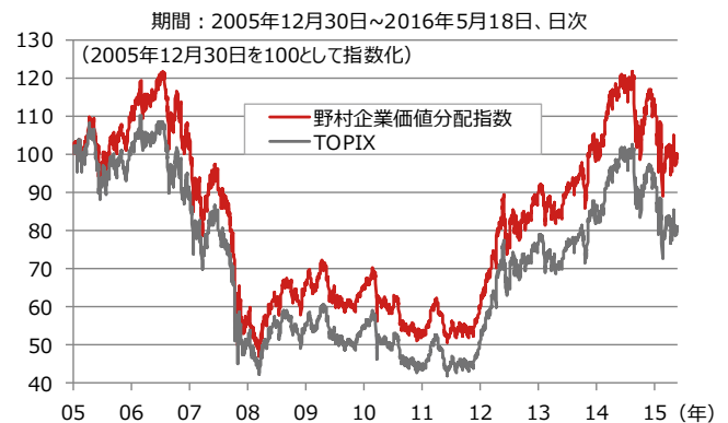
図3：野村企業価値分配指数の推移

( http://www.mof.go.jp/pri/reference/bos/results/index.htm ) より野村アセットマネジメント作成