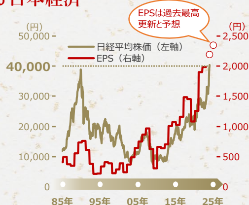
日経平均株価は1985年1月末～2024年3月末（月次）、日経平均株価のEPSは1985年度-2024年度（年次、2023年度-2024年度は野村証券予想）

要因としては、東証の市場改革や新NISAなどに加え、デフレ * 脱却が注目されています。物価上昇に伴い、2023年の名目GDPが1991年以来の高い成長率となったほか、2%の物価目標の実現が見通せると判断されマイナス金利政策も解除されました。日本経済は数十年続いたデフレから完全に脱する転換点にあると期待されています。 * 物価が持続的に下落する状況