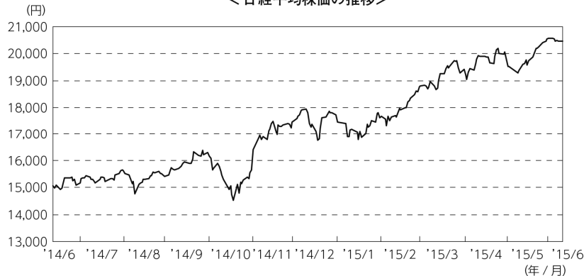
<日経平均株価の推移>

設定時から2014年9月末にかけては、中国の景気指標の改善や米国株式市場の上昇などを好感したこと、政府の成長戦略への期待感が広がったことなどから株式市場は上昇しました。10月上旬に世界景気の先行き不透明感や米国内でのエボラ出血熱の感染拡大が懸念されたことから一時下落する局面があったものの、同月末に日銀が追加金融緩和を決定したことから再び上昇しました。2015年に入っても、ECB（欧州中央銀行）の量的緩和導入や米国の早期利上げ観測の後退、国内景気の回復や企業業績の拡大期待から引き続き上昇しました。