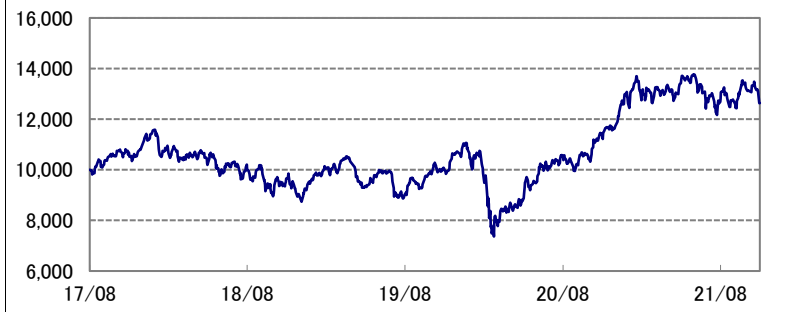
基準価額の推移 * 当ファンドの設定日当日=10,000として指数化: 日次

* 当ファンドの設定日とは、 未来時計DC・つみたてNISA 2030の設定日(2017年8月31 日)を指します。