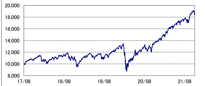
基準価額の推移 * 当ファンドの設定日当日=10,000として指数化: 日次

* 当ファンドの設定日とは、 未来時計DC・つみたてNISA 2030の設定日(2017年8月31 日)を指します。