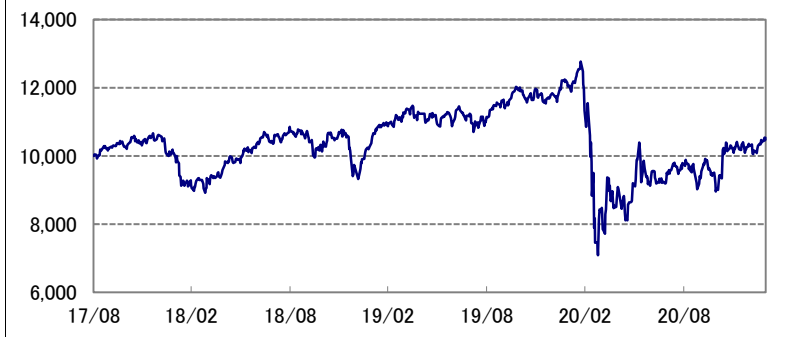
基準価額の推移 * 当ファンドの設定日当日=10,000として指数化: 日次

* 当ファンドの設定日とは、 未来時計DC・つみたてNISA 2040の設定日(2017年8月31 日)を指します。