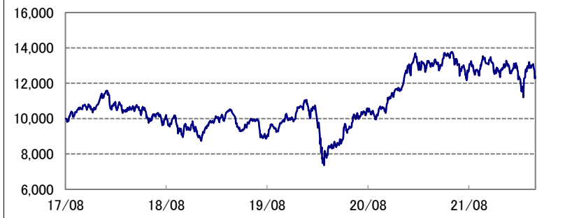
基準価額の推移 * 当ファンドの設定日当日=10,000として指数化: 日次

* 当ファンドの設定日とは、 未来時計DC・つみたてNISA 2050の設定日(2017年8月31 日)を指します。