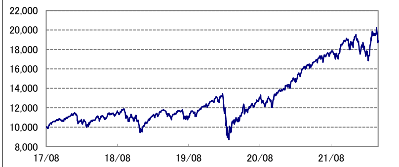
基準価額の推移 * 当ファンドの設定日当日=10,000として指数化: 日次

* 当ファンドの設定日とは、 未来時計DC・つみたてNISA 2050の設定日(2017年8月31 日)を指します。