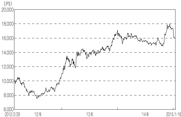
〈設定来の基準価額の推移〉