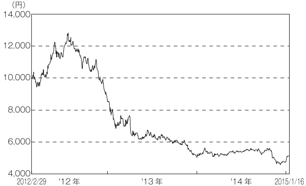
〈設定来の基準価額の推移〉