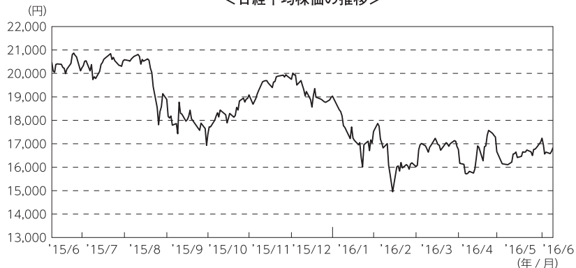
<日経平均株価の推移>

2016年1月下旬には、日欧の中央銀行における金融緩和姿勢から反発に転じましたが、2月上旬には、米国経済の先行き懸念の高まりや、日銀によるマイナス金利導入の影響により金融機関の利益減少懸念が高まったことなどから、株式市場は再び下落しました。2月末以降は、下落が続いていた原油価格に反転の兆しが見えたことなどから反発する場面もありましたが、外国為替相場の方向感が定まらないことや、中国株式市場が軟調であったことから、株式市場は一進一退で推移しました。