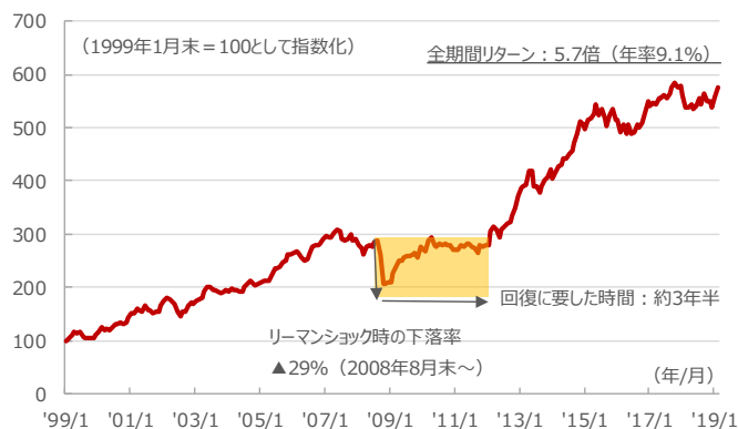
図5：新興国債券指数（新興国通貨戦略）の推移