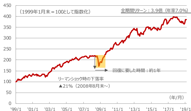
図4：新興国債券指数（為替ヘッジ無し）の推移