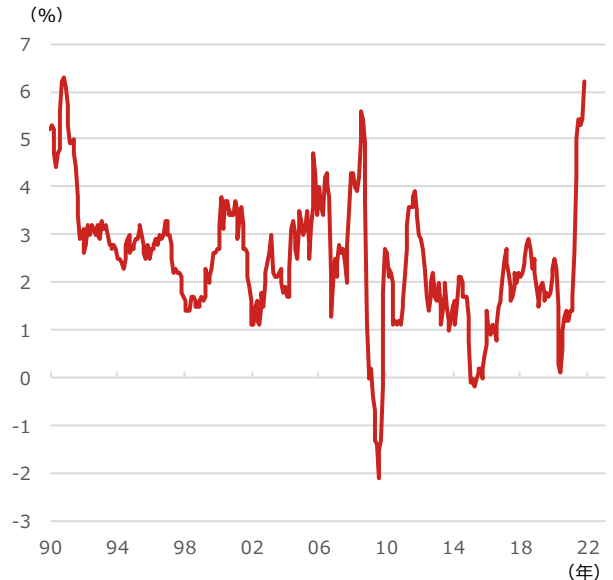
米CPI（消費者物価指数）

期間：1990年1月～2021年10月、月次 （出所）Bloombergより野村アセットマネジメント作成