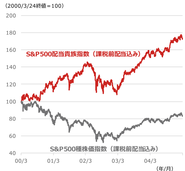
期間：2000年3月24日～2005年3月23日、日次 ・いずれの指数も米ドルベース ・「高値」とはS&P500種株価指数が終値ベースで高値をつけた時点を指す (出所) Bloombergより野村アセットマネジメント作成