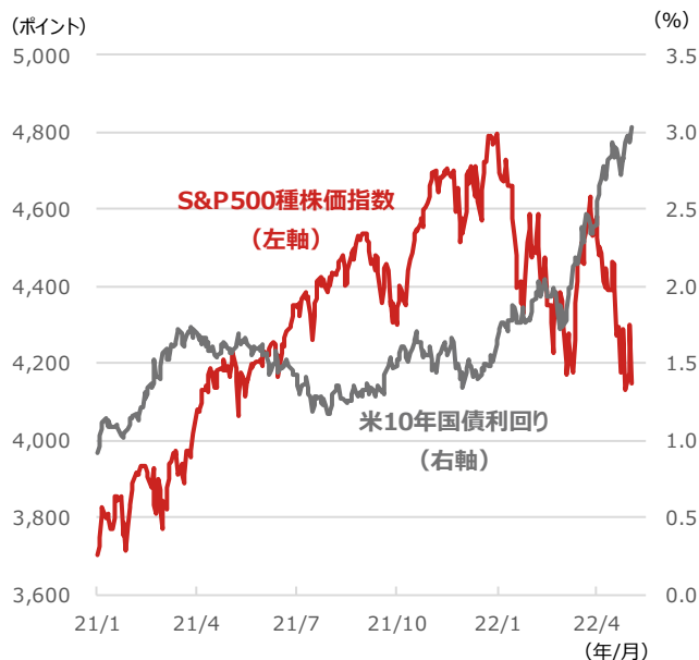
S&P500種株価指数と米10年国債利回り

期間：2021年1月4日～2022年5月5日、日次 （出所）Bloombergより野村アセットマネジメント作成