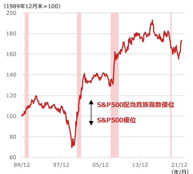
期間：1989年12月末～2022年6月23日、月次 ・いずれの指数も米ドルベース、課税前配当込み ・網掛けは米景気後退局面