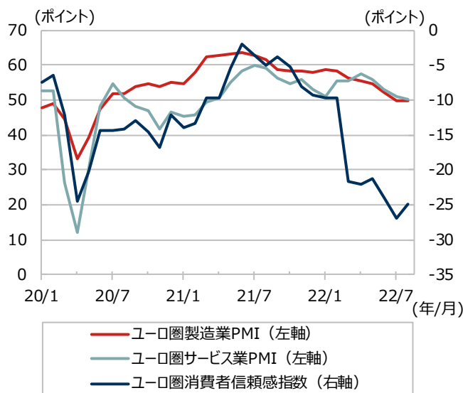
ユーロ圏PMIと消費者信頼感指数

期間：2020年1月～2022年8月、月次