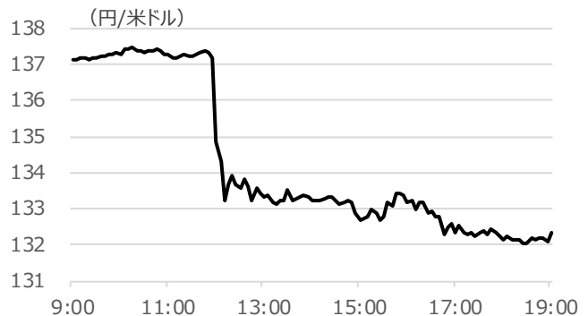
米ドル円レートの日中の推移

期間：2022年12月20日 9:00～19:00、5分足