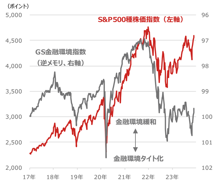
期間：2017年1月6日～2023年12月1日、週次 （出所）Bloombergより野村アセットマネジメント作成