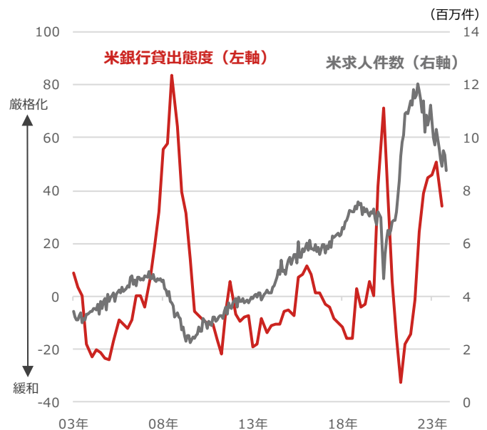
米銀行貸出態度と米求人件数

期間：（米銀行貸出態度）2003年Q1（1-3月期）～2023年Q3（7-9月期）、四半期（米求人件数）2003年1月～2023年10月、月次 ・米銀行貸出態度は大・中企業向け商用ローン基準を厳格化した銀行の割合（ネット） ・米求人件数はJOLTS（米雇用動態調査）の数値を用いた