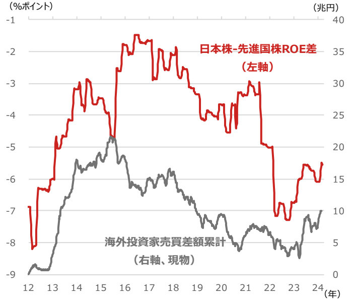
日本株-先進国株ROE（自己資本利益率）差（4週移動平均）と海外投資家売買差額累計

期間：（日本株-先進国株ROE差）2012年1月6日～2024年3月4日、週次 （海外投資家売買差額累計）2012年1月第1週～2024年2月第3週、週次 ・日本株：TOPIX（東証株価指数） ・先進国株：MSCI World Index