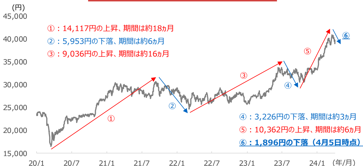
日経平均株価の推移

① : 2020/3/19～、② : 2021/9/14～、③ : 2022/3/9～、④ : 2023/7/3～、⑤ : 2023/10/4～、⑥ : 2024/3/22～