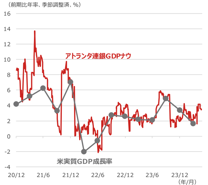
アトランタ連銀GDP（国内総生産）ナウと米実質GDP成長率

期間：（アトランタ連銀GDPナウ）2020年12月31日～2024年5月24日、日次 （米実質GDP成長率）2020年10-12月期～2024年1-3月期、四半期