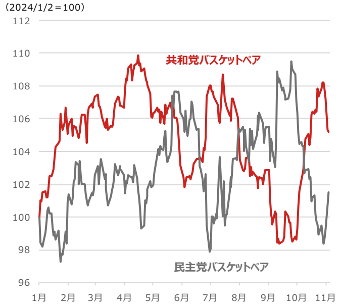
期間：2024年1月2日～2024年11月5日、日次 ・共和党・民主党バスケットペアは、ゴールドマンサックス算出の政党別の勝利を予想した取引戦略を追跡する指数