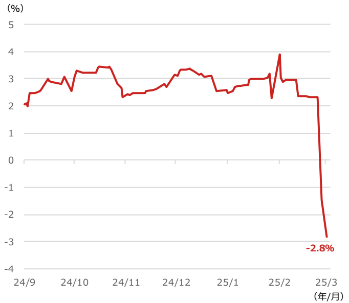
アトランタ連銀GDP（国内総生産）ナウ

期間：2024年9月3日～2025年3月3日、日次 ・アトランタ連銀GDPナウは最新の米実質GDP成長率を予測しており、2024年10-12月期実質GDP成長率が発表された2025年1月30日以降は2025年1-3月期の実質GDP成長率予測を示している ・グラフの数字は2025年3月3日時点の予測値