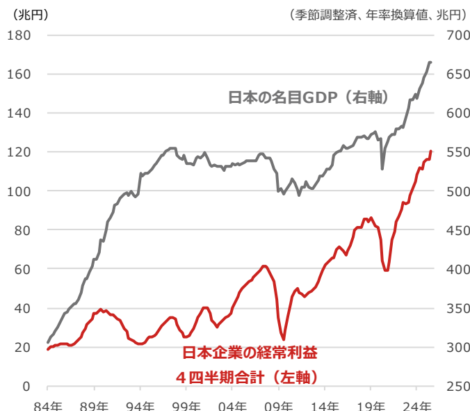
日本企業の経常利益4四半期合計と日本の名目GDP（国内総生産）

期間：1984年1-3月期～2025年7-9月期、四半期 ・日本企業の経常利益は法人企業統計のデータを用いた (出所) Bloombergより野村アセットマネジメント作成