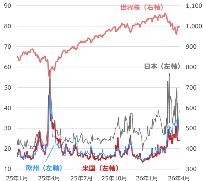
日米欧のボラティリティ・インデックスと世界株

期間：(欧VSTOXX) 2025年1月6日～2026年4月2日、日次 (その他) 2025年1月6日～2026年4月6日、日次 ・世界株はMSCI All Country World Index (米ドルベース) ・ボラティリティ・インデックスは一般的に同指数の数値が高いほど、投資家の先行き不透明感が強いとされる（別名：恐怖指数）。日本は日経平均VI、米国はVIX、欧州はVSTOXX。