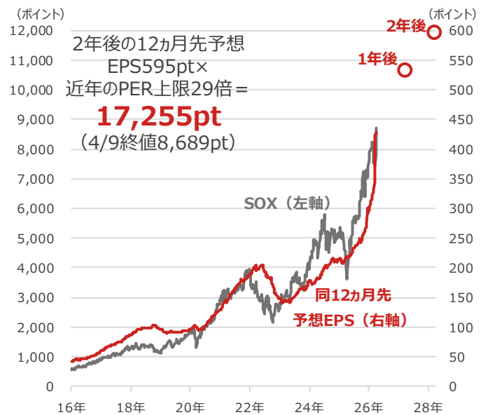
期間：2016年1月8日～2026年4月9日、週次 ・○印は1年後、2年後の12か月先予想EPS（2026年4月9日時点のBloomberg予想） （出所）Bloombergより野村アセットマネジメント作成

個別銘柄の記載は、特定銘柄の売買などの推奨、また価格の上昇や下落を示唆するものではありません。