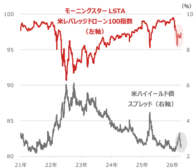
米レバレッジドローン100指数と 米ハイイールド債スプレッド

期間：（米レバレッジドローン100指数）2021年1月4日～2026年4月20日、日次 （米ハイイールド債スプレッド）2021年1月4日～2026年4月17日、日次 ・米ハイイールド債スプレッドは米10年国債利回りとの差、CSI BARC Indexを用いた ・レバレッジドローンは信用力の低い企業向け融資 （出所）Bloombergより野村アセットマネジメント作成