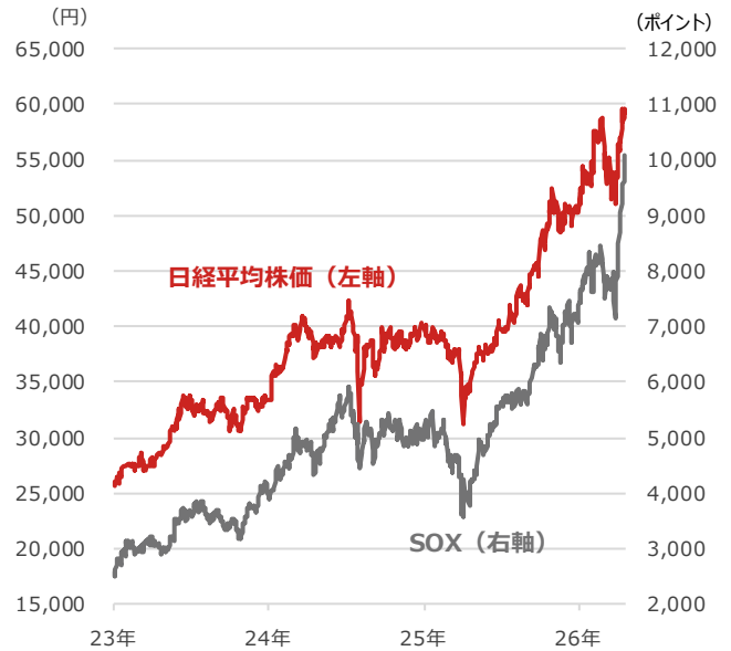
日経平均株価とSOX（フィラデルフィア半導体株指数）

期間：2023年1月4日～2026年4月23日、日次