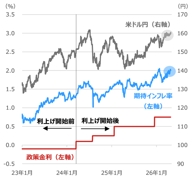
日本の政策金利・期待インフレ率（10年）と米ドル円

期間：（米ドル円）2023年1月4日～2026年4月29日、日次 （その他）2023年1月4日～2026年4月28日、日次 ・期待インフレ率は10年国債利回り・物価連動国債利回り（10年）で算出 ・政策金利は2024年3月18日までは政策金利残高への適用金利、それ以降は無担保コール翌日物レート、レンジの場合はその上限値