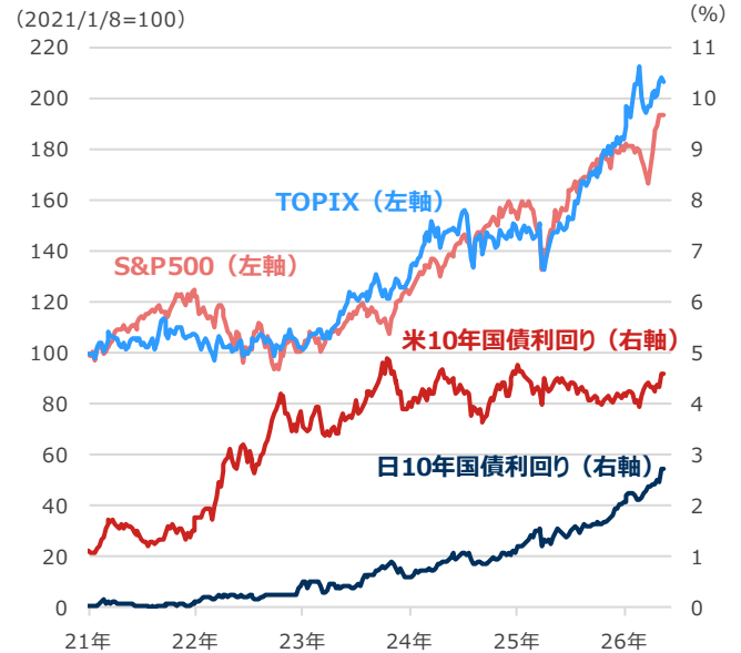
S&P500・TOPIX（東証株価指数）と日米10年国債利回り

期間：2021年1月8日～2026年5月18日、週次