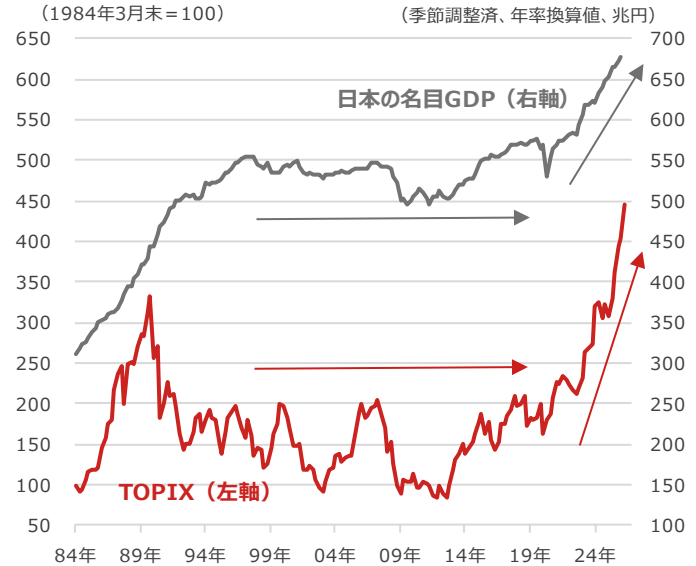
TOPIX（東証株価指数）と日本の名目GDP（国内総生産）

期間：（日本の名目GDP）1984年1-3月期～2026年1-3月期、四半期 （TOPIX）1984年3月末～2026年5月19日、四半期 （出所）Bloomberg、内閣府（ https://www.cao.go.jp/ ）より野村アセットマネジメント作成