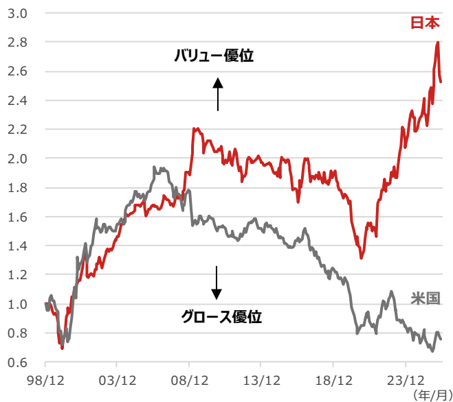
日米株のバリュー/グロスの相対パフォーマンス

期間：1998年12月末～2026年5月22日、月次 ・日本株のバリューはラッセル野村総合バリュー・インデックス、グロスはラッセル野村総合グロス・インデックス、米国株のバリューはラッセル1000/バリューインデックス（米ドルベース）、グロスはラッセル1000グロスインデックス（米ドルベース）、いずれも配当込み （出所）Bloombergより野村アセットマネジメント作成