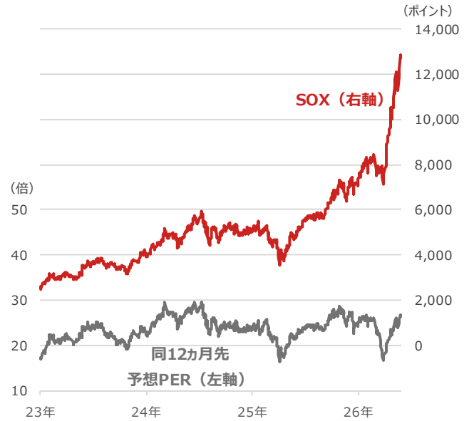
SOX（フィラデルフィア半導体株指数）と 同12ヵ月先予想PER（株価収益率）

期間：2023年1月3日～2026年5月28日、日次 (出所) Bloombergより野村アセットマネジメント作成